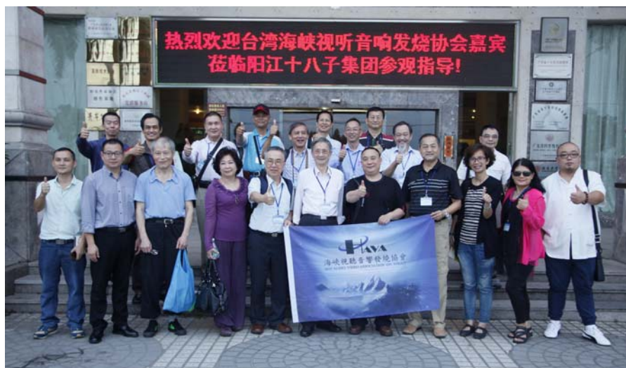
陽江十八子世界發燒音響博物館前合影