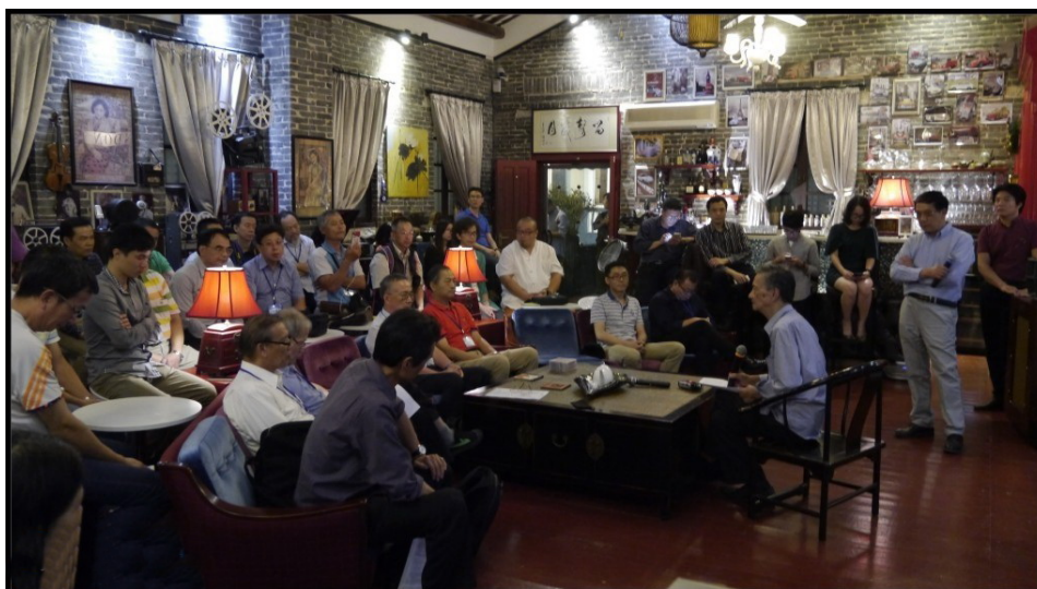
兩岸論壇在中山小欖鎮“留聲歲月”音樂俱樂部舉行