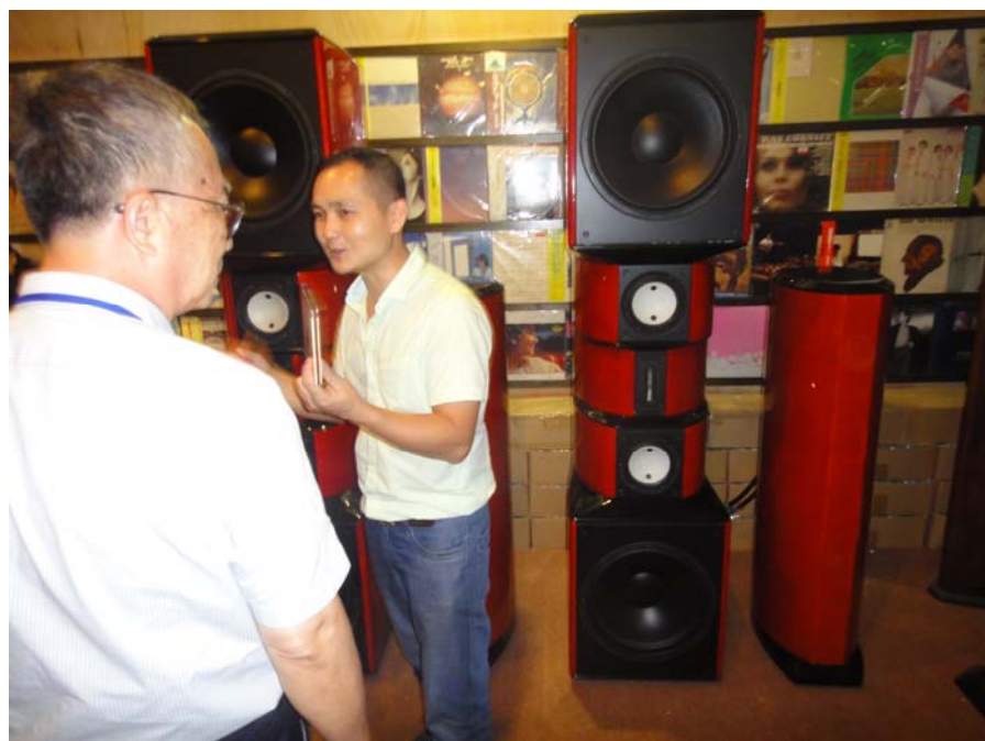
陽江世界發燒音響博物館展室