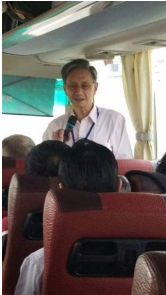
大巴行進中的交流